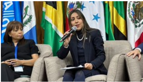
3 by Sesan GT uploaded on 25 Apr 2023