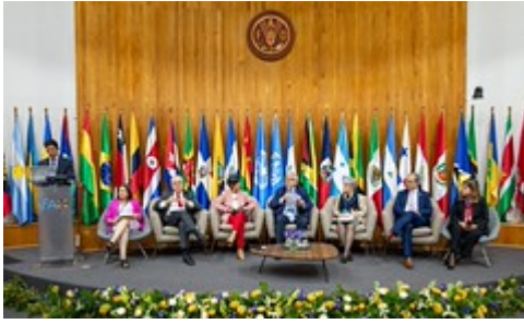
9 by Sesan GT uploaded on 25 Apr 2023