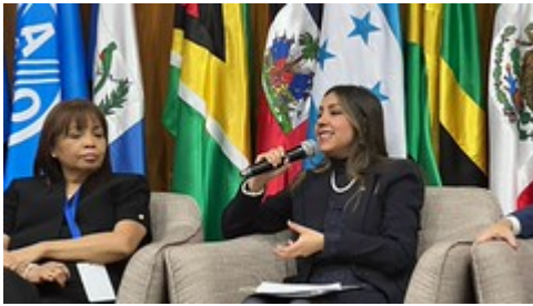
8 by Sesan GT uploaded on 25 Apr 2023