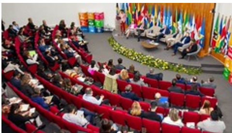
5 by Sesan GT uploaded on 25 Apr 2023