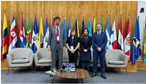
7 by Sesan GT uploaded on 25 Apr 2023