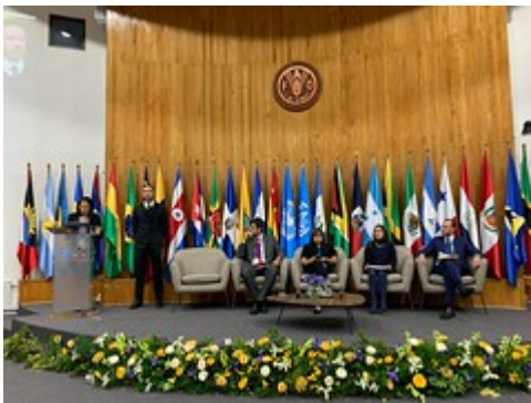
2 by Sesan GT uploaded on 25 Apr 2023