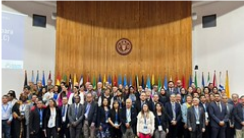
4 by Sesan GT uploaded on 25 Apr 2023