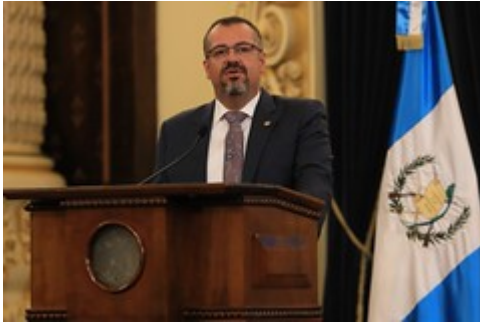
Conferencia de Prensa Semanal 30.08.2021 by Gobierno de Guatemala uploaded on 30 Aug 2021