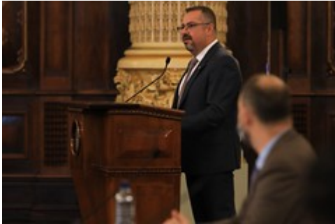
Conferencia de Prensa Semanal 30.08.2021 uploaded on 30 Aug 2021