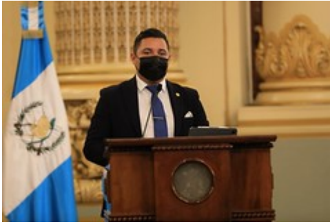
Conferencia de Prensa Semanal 30.08.2021 by Gobierno de Guatemala uploaded on 30 Aug 2021