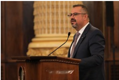
Conferencia de Prensa Semanal 30.08.2021 by Gobierno de Guatemala uploaded on 30 Aug 2021