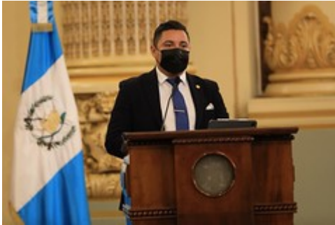
Conferencia de Prensa Semanal 30.08.2021 by Gobierno de Guatemala uploaded on 30 Aug 2021