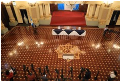
Conferencia de Prensa Semanal 30.08.2021 by Gobierno de Guatemala uploaded on 30 Aug 2021