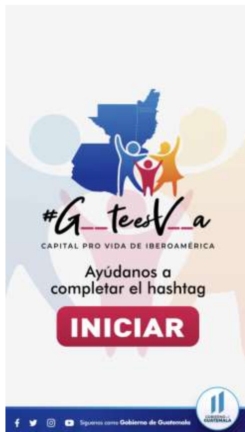
▶ Pauta Digital Completa la Palabra

CAMPAÑA DE COMUNICACIÓN PRO VIDA | RESULTADOS