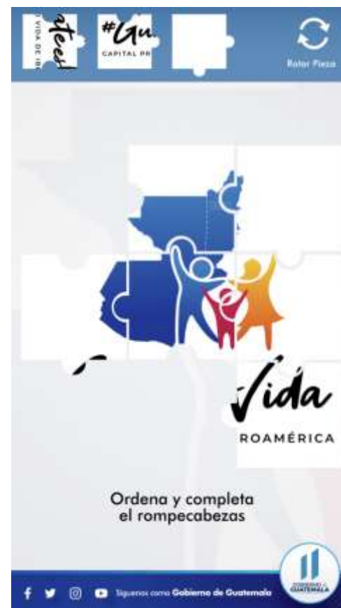
▶ Pauta Digital Rompecabezas