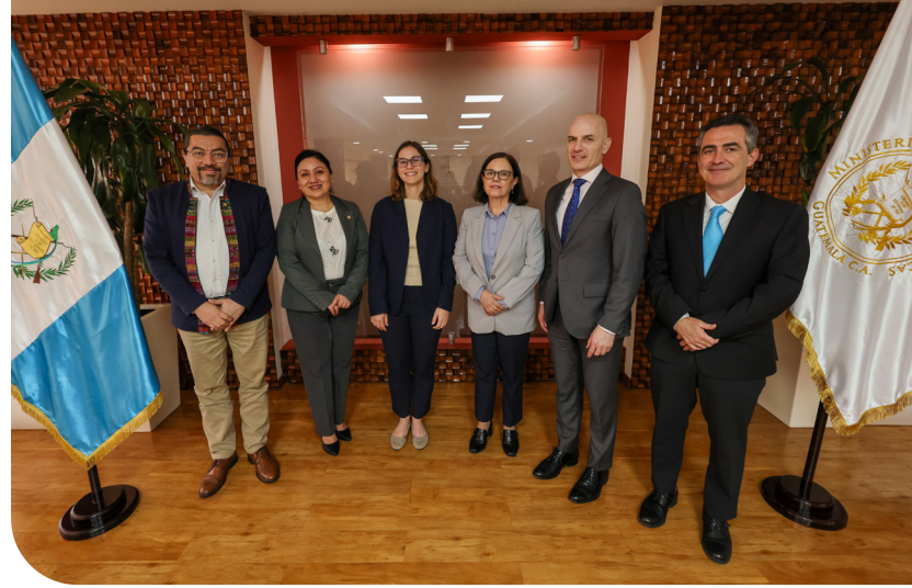
La misión exploratoria del FMI proporcionó una visión inicial de los avances y desafíos que enfrenta Guatemala en la administración de su gasto público.

La información recopilada servirá como insumo para la elaboración de un diagnóstico preliminar que será presentado en la consulta anual sobre el Artículo IV, que realizará el FMI a mediados de 2025.