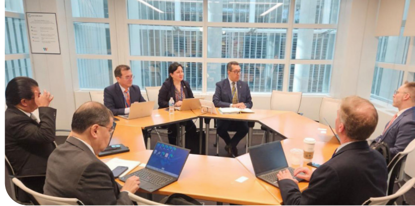
La delegación del Minfin sostuvo reuniones con delegados de las calificadoras de riesgo, grupo de inversores y funcionarios del GMB y FMI.