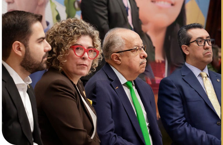
El Gobierno de Guatemala anunció medidas para garantizar certeza y estabilidad a Guatemala.

Explicó que se solicitó al Banco de Guatemala desarrollar modelos que evalúen el estrés de la economía internacional para comprender con precisión los efectos que podría tener sobre el entorno nacional. “Las pruebas nos permitirán entender el grado de impacto de los cambios en la economía global y si hay algún signo de debilitamiento en las principales economías con las que comerciamos”, añadió el Ministro.