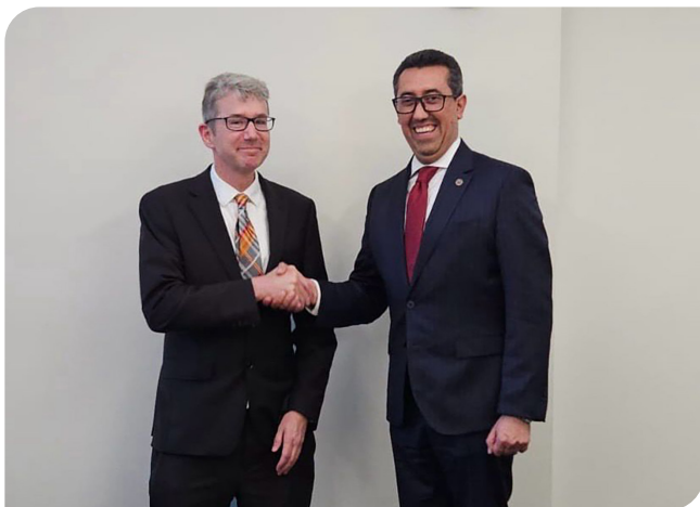
Reunión entre el Ministro de Finanzas Públicas y Scott Rembrandt.

En ese contexto, el ministro Menkos Zeissig tuvo un acercamiento con Scott Rembrandt, subsecretario adjunto de Política Estratégica de la Oficina de Financiamiento del Terrorismo y Delitos Financieros del Departamento del Tesoro de los Estados Unidos. En la reunión destacaron los avances del Gobierno de Guatemala y reafirmaron su compromiso de continuar la colaboración conjunta en transparencia fiscal, crecimiento económico sostenible, lucha contra la corrupción y lavado de dinero proveniente del narcotráfico y crimen organizado.