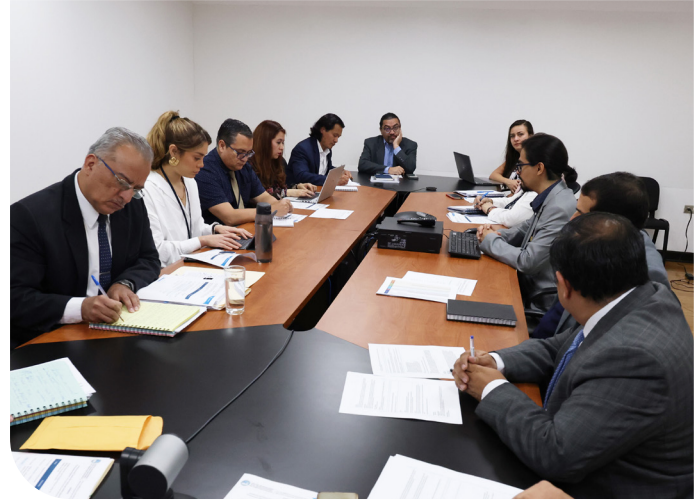
En 2024, se realizaron cinco talleres para revisar la información que se publica en los documentos evaluados por el OBI.

Como parte de este proceso, en agosto y septiembre de 2024, bajo la coordinación de Carlos Melgar, viceministro de Transparencia Fiscal y Adquisiciones del Estado, y de la Dirección de Transparencia Fiscal, se realizaron cinco talleres para revisar la información que se publica en los siete documentos que competen al Ministerio.