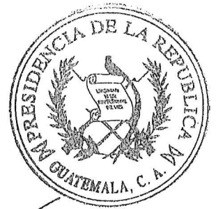
Mercé Antonia Villeda Sandoval Ministra de Gobernación